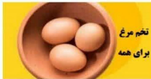
تخم مرغ برای همه

در بسیاری از مردم بدون در نظر گرفتن سن و نژاد آنها، مصرف تخم مرغ حتی بیش از یک عدد در روز نه تنها باعث افزایش کلسترول خون نشده بلکه برای سلامت قلب نیز مفید می باشد.